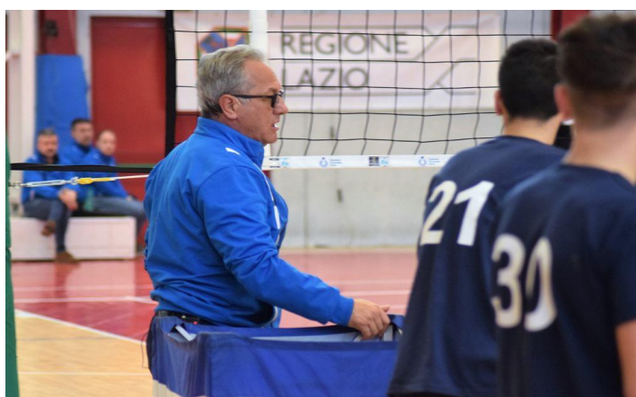
Julio Velasco - Foto Fipav Lazio

Il palazzetto dello sport di Monterotondo è stato scenario di uno stupendo evento concernente il volley, con l'allenatore argentino Julio Velasco a far da Cicerone a circa 500 allenatori provenienti dal centro Italia. Il tecnico sudamericano ha attuato un corso di formazione, proposto dalla FIPAV , il quale ha riscosso grande successo fra gli interessati. Velasco è dunque stato protagonista di una giornata all'insegna dello sport, utile per chi ha appreso i consigli di un grande del settore volley. La cittadina in provincia di Roma non è però stata l'unica sede scelta dal direttore tecnico del settore giovanile maschile della FIPAV, che aveva già preso parte ad un evento simile a Milano e sarà presente ad un altro a Napoli .