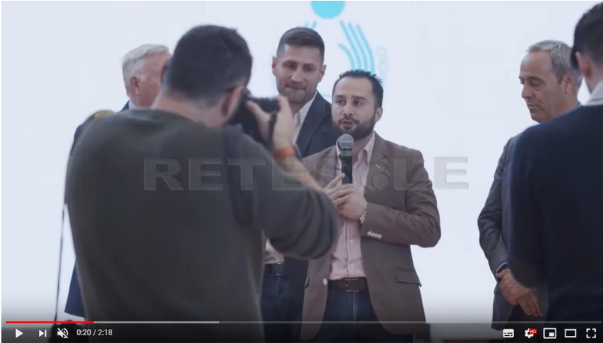
RETESOLE Volley, a Monterotondo il corso di Julio Velasco per dirigenti e allenatori