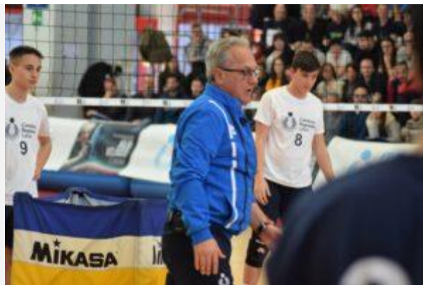
Coach Velasco durante l'evento

“La città di Monterotondo ha risposto alla grande a questo secondo appuntamento di formazione – ha dichiarato Julio Velasco a margine dell’evento – È stato un ottimo momento per tutti gli allenatori del centro Italia, spero siano soddisfatti del nostro incontro e mi auguro che nei prossimi anni vada sempre meglio. Non c’è una sola idea corretta di pallavolo: vorrei che i tecnici lo capissero. Il movimento è davvero importante, tutte le regioni hanno una grande attività. Io cerco di dare degli spunti per affrontare al meglio le opportunità che nascono nell’allenare i giovani”.