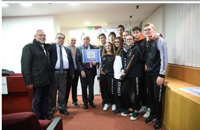
In foto La Fenice, ha ricevuto il Certificato Oro

Altro su: Pallavolo , Fipav lazio , Stagione 2019/2020