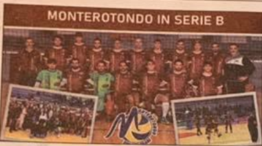
MONTEROTONDO IN SERIE B

"Credo che festeggeremo in occasione della partita d'esordio in Serie B, insieme ai nostri tifosi e, perché no, insieme