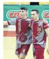
Dopo aver visto sfumare la promozione in B il Monterotondo ci riprova