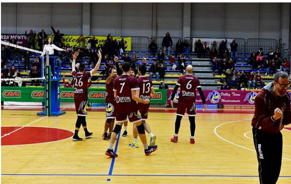
Volley Team Monterotondo

Altro su: Pallavolo , Volley team monterotondo , Serie bpallavolo