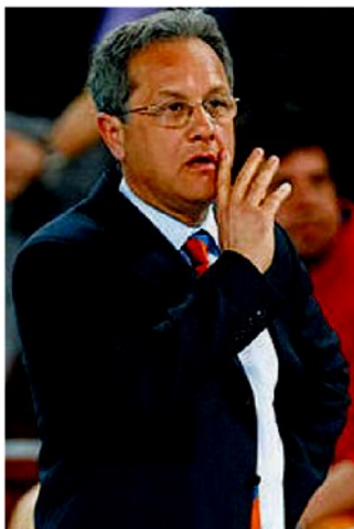
Talento L'ex ct azzurro Julio Velasco