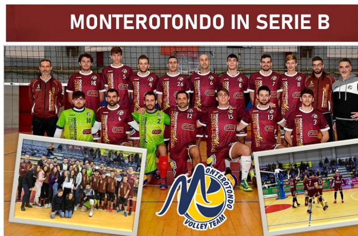
Volley Team Monterotondo